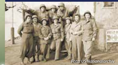
Die ersten Armeekrankenschwestern überqueren den Rhein mit dem 51ten Feldlazarett.

Ein Junge oder junger Mann, der ein Schwert und einen Lorbeerkranz hält, erinnert uns daran, dass diejenigen, die hier begraben sind, in den besten Jahren ihres Lebens starben. Sie verkörpern die Bedeutung der Aufopferung.