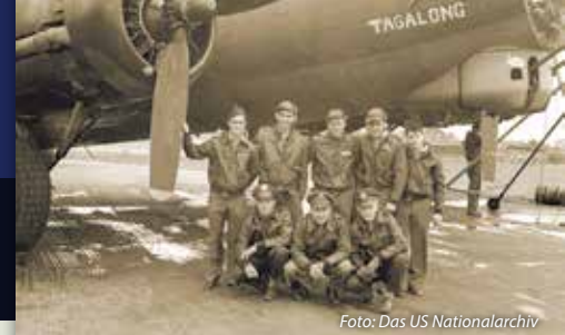
Eine B-17G-Flugbesatzung der 379sten Bomber-Gruppe (H), Achte US Air Force.